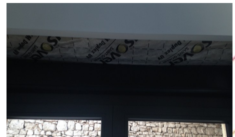
Mise en place de frein vapeur